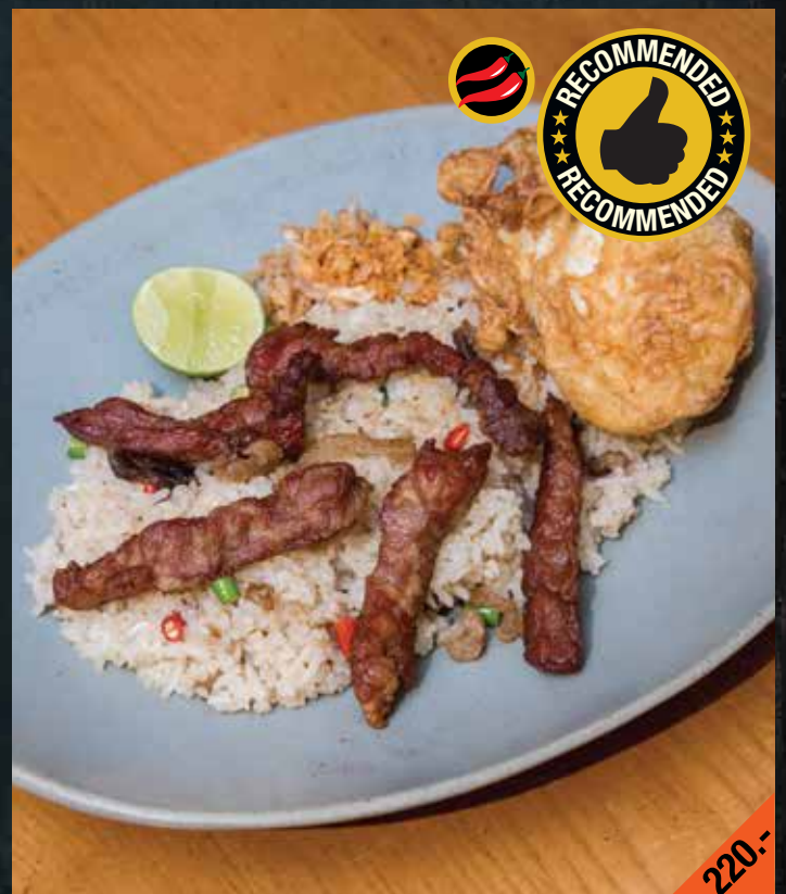
ข้าวผัดมันเนื้อเสือร้องไห้ โปะเนื้อแดดเดียวไข่ดาว Kao Pad Mun Nuea Suea Rong Hai

Fried rice with Isan wagyu brisket fat, deep-fried sun dried beef, and egg