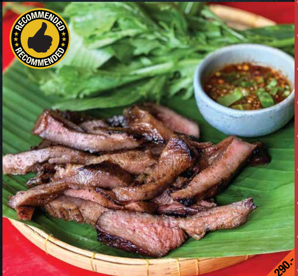
ลิ้นวัวอีสานวากิวย่าง Lin Isan Wagyu Yang