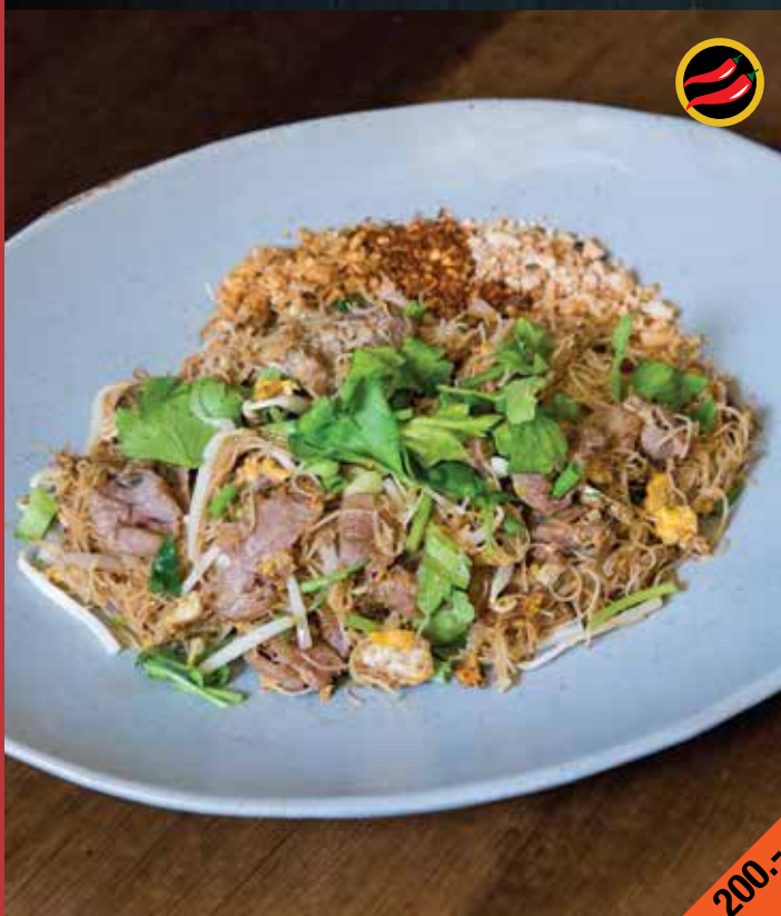
ผัดหมี่แห้งเนื้อลายสด Pad Mee Hang Nuea Lai

Stir-fried rice noodles with sliced marbled beef shank and egg