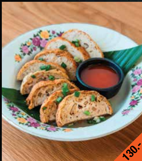
หมูยออุดรทอด (เนื้อและหนัง) Moo Yor Tod