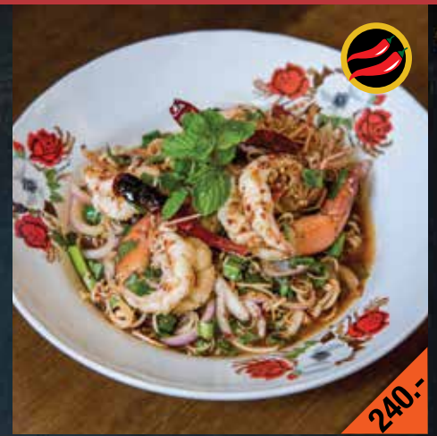
ก้อยกุ้ง Goi Goong

Isan wagyu (sliced/minced) brisket salad with cooked cow blood (with/ without bile)