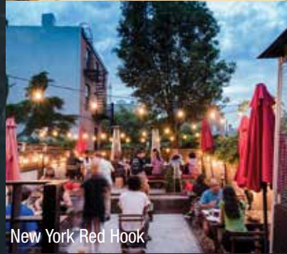
New York Red Hook