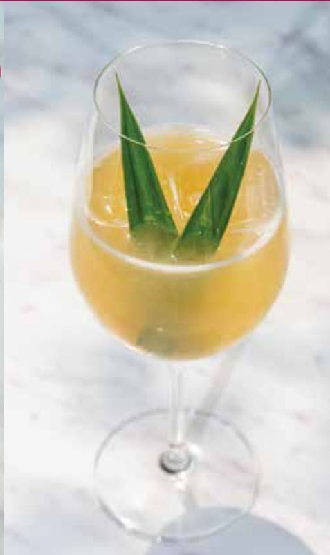
แม่โขงทรอปิคอลฟิซ MEKHONG TROPICAL FIZZ