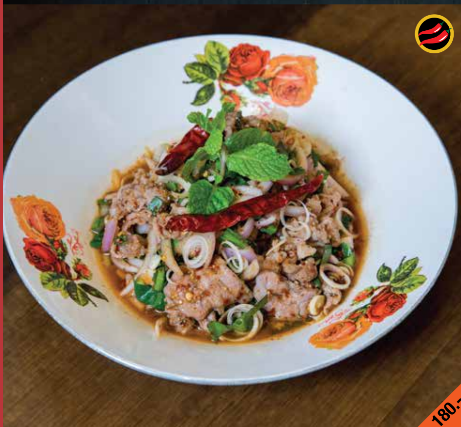
ลาบเนื้อลาย Larb Nuea Lai

Spicy duck meat salad with glass vermicelli and minced roasted rice