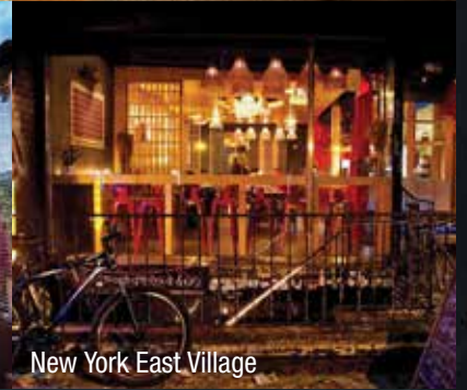
New York East Village

In the blink of an eye, Somtum Der is now 10 years old. From 2012 when we opened the first Somtum Der in a small shop-house in Saladaeng to the expansion of our international branches in New York, Tokyo and Taipei.