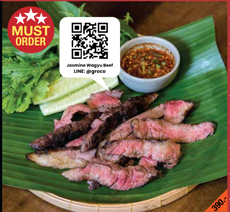
เสื่ออีสานวากิวย่างจิ้มแจ่วขม Suea Isan Wagyu Yang

Charcoal grilled Isan wagyu brisket with spicy bitter dipping