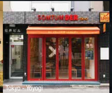
Tokyo - Yoyogi