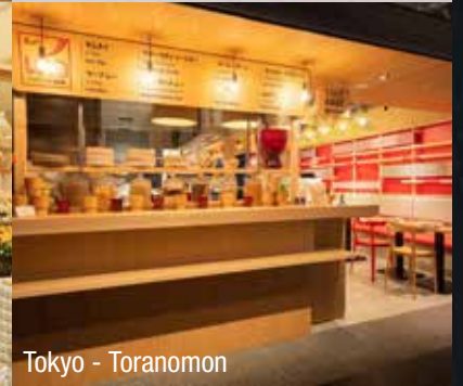
Tokyo - Toranomon