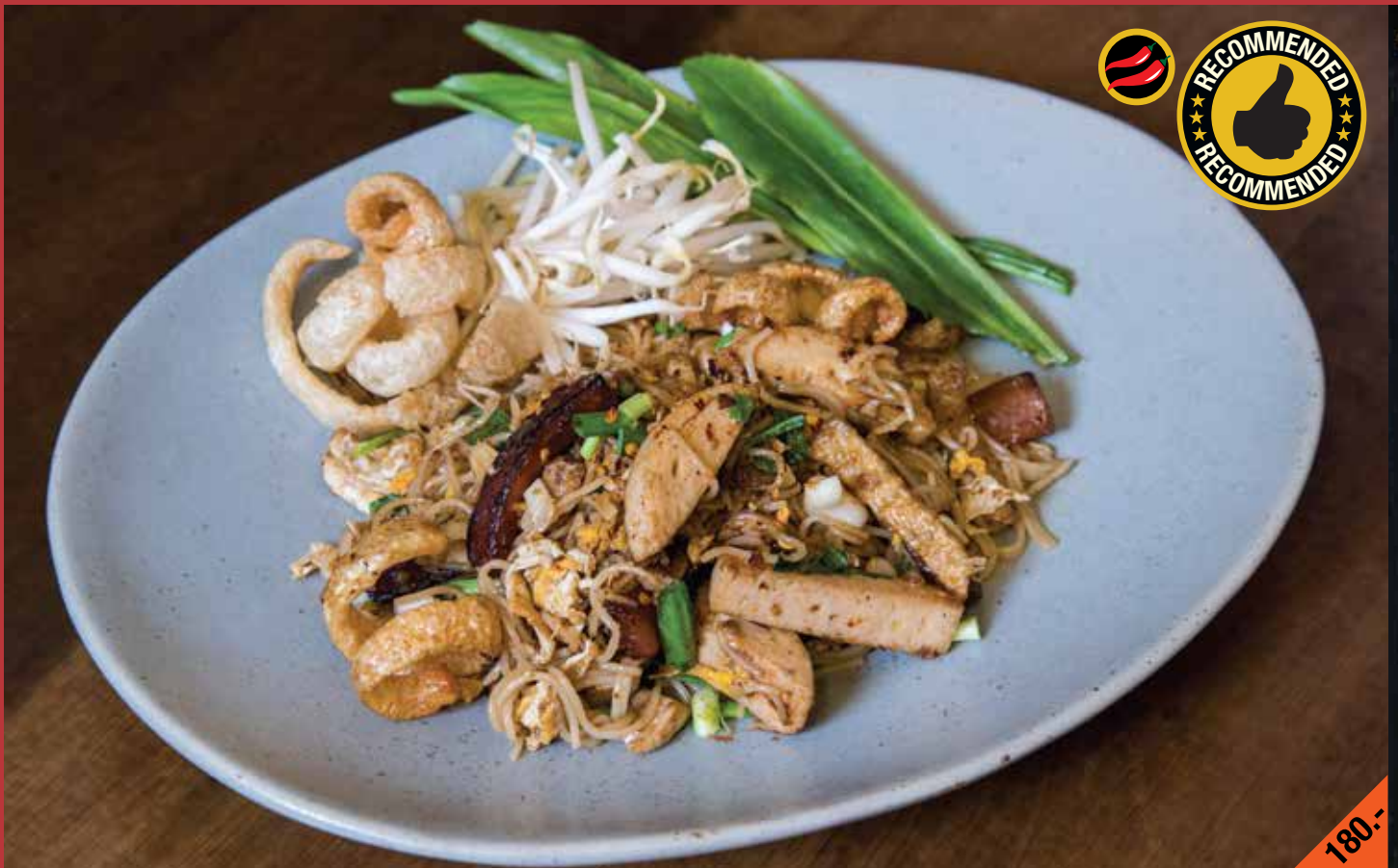
ผัดขนมนจีนอีสาน Pad Kanom Jeen Isan

Stir-fried rice vermicelli with Vietnamese sausage, Chinese sausage, egg, and fermented fish