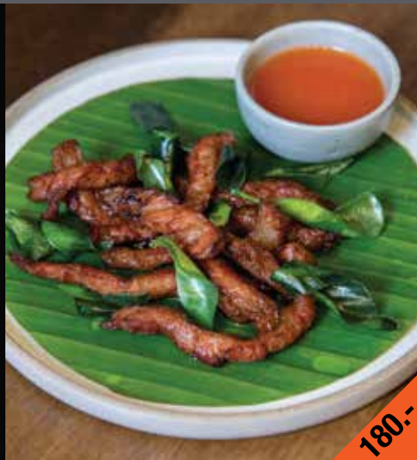
เนื้อแดดเดียว Nuea Dad Diao