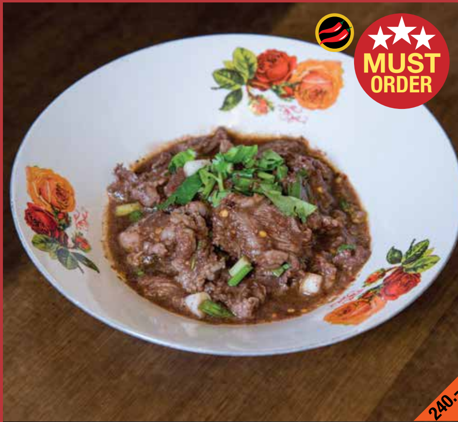
ก้อยคั่วเสื่ออีสานวากิว (ชิ้น/สับ, ขม/ไม่ขม) Goi Kua Suea Isan Wagyu

Isan wagyu (sliced/minced) brisket salad with cooked cow blood (with/ without bile)