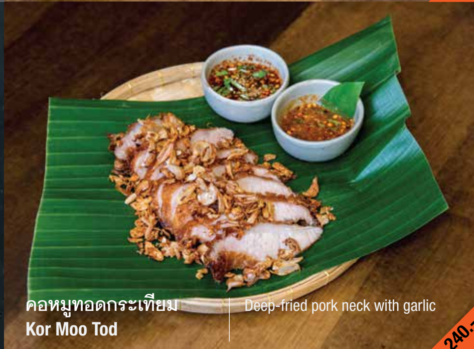
คอหมูทอดกระเทียม Kor Moo Tod