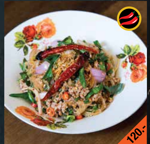
ลาบเปิดวุ้นเส้นเผ็ด Larb Ped Woon Sen

Soft boiled prawns mixed with fresh herbs and minced roasted rice