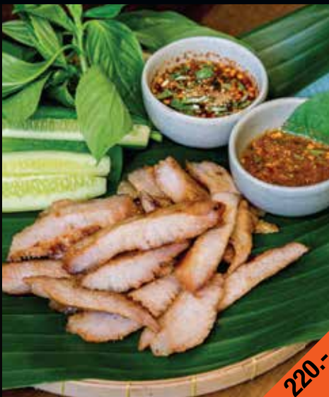
คอหมูย่างถ่าน Kor Moo Yang Grilled Pork Neck

Charcoal grilled Isan wagyu brisket with spicy bitter dipping