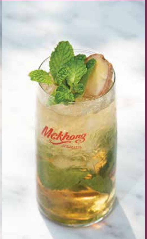
แม่โขงจินเจอร์โมฮิตโต้ MEKHONG GINGER MOJITO