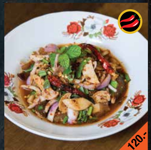
ลาบเห็ด Larb Hed